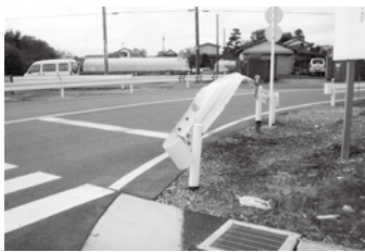
事故により壊された道路施設

ただし、規模が大きい破損などは、工事の発注が必要となるため、復旧に時間がかかることがあります。皆さまのご理解とご協力をお願いします。