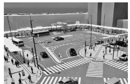
吉川駅北口駅前交通広場改修工事