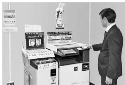
書かない窓口の推進