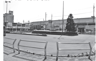
吉川駅北口駅前交通広場改修工事の設計