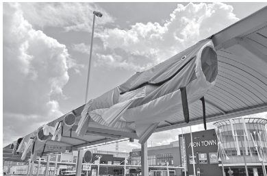
なまずのぼりの制作