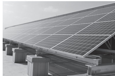
再生エネルギー(電気)の購入