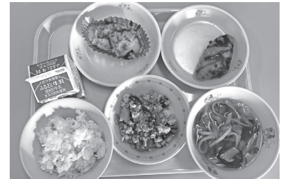
国産なまずを用いた給食の提供