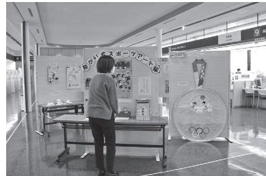
障がい者アート展の開催