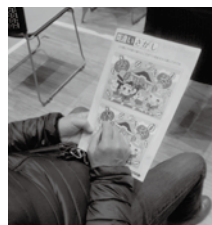
接種会場にて配布

の「迷路クリエイター」である「吉 川めいろ」さん作の吉川市の形 をした「迷路」になっており、掲 載されている「クイズ」や「間違 い探し」なども市に関連するも のが盛りだくさんとなっています ▼高齢者の方々のワクチン接 種会場から配布を始め、現在は、 市役所総 合案内や 各公施設 設でお配 りしてい る、市オリジナルの「脳活ドリ ル」。皆さんの健康長寿に向け てはもちろんのこと、新型コロナ ナウイルスの影響により外出が 思うようにできない時などに、 ご家族との楽しい「おうち時間」 の一助となれば何よりです。