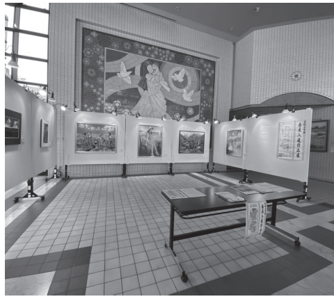
展示の様子(中央公民館ロビー)

例年3500点を超える出品がある埼玉県美術展覧会(県展)で入選・入賞を果たした市内在住の方の作品を展示しています。