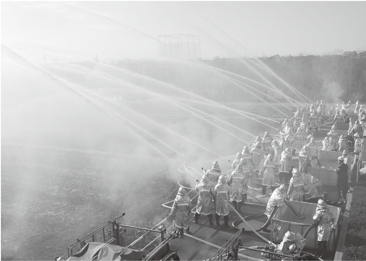
消防出初め式（※8ページに説明があります。）