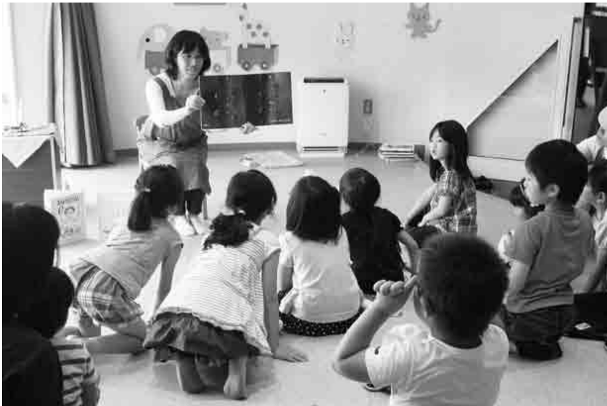
「物語の世界に引き込まれる子供達」(市立図書館の「おはなし会」※8ページに説明があります。)