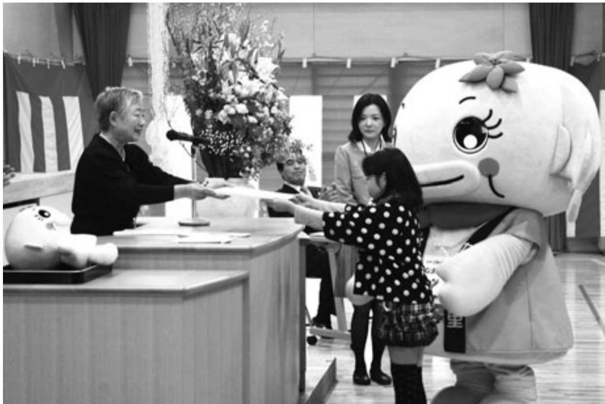
美南小学校竣工記念式典（8ページに写真説明があります。）