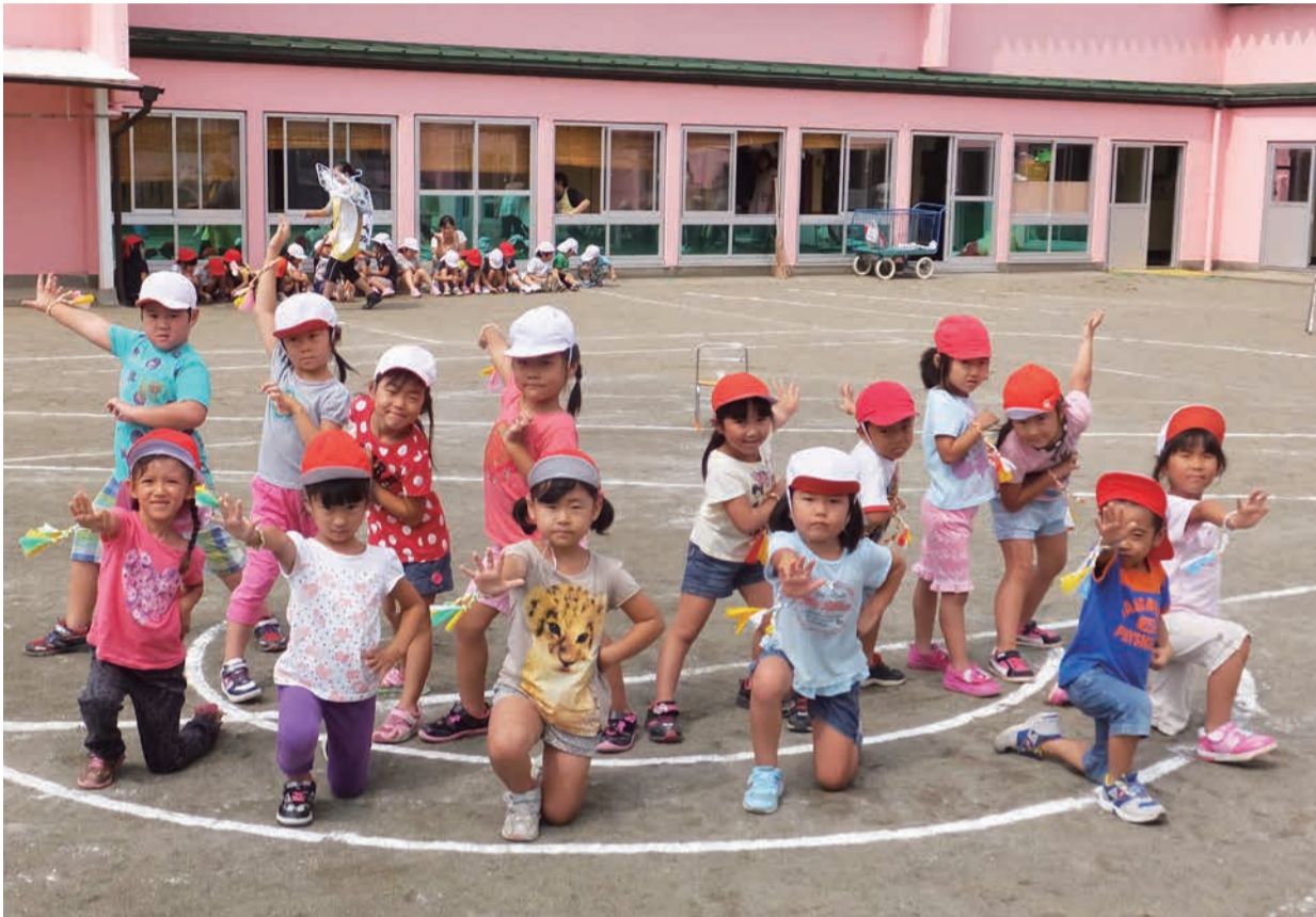
運動会の練習中のようす (※8ページに写真説明があります。)

発行：吉川市議会 編集：吉川市議会広報委員会 〒342-8501 吉川市吉川二丁目1番地1 TEL & FAX (982) 9421 http://www.city.yoshikawa.saitama.jp