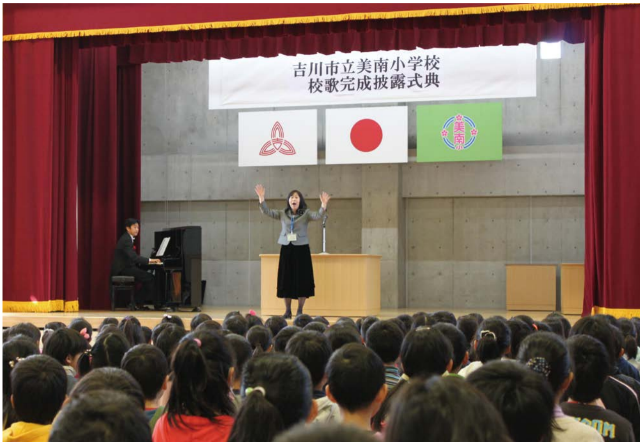
美南小学校校歌完成披露式典（8ページに写真説明があります。）

発行：吉川市議会 編集：吉川市議会広報委員会 〒342-8501 吉川市吉川二丁目1番地1 TEL & FAX (982) 9421 http://www.city.yoshikawa.saitama.jp