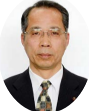
互 金次郎 副議長