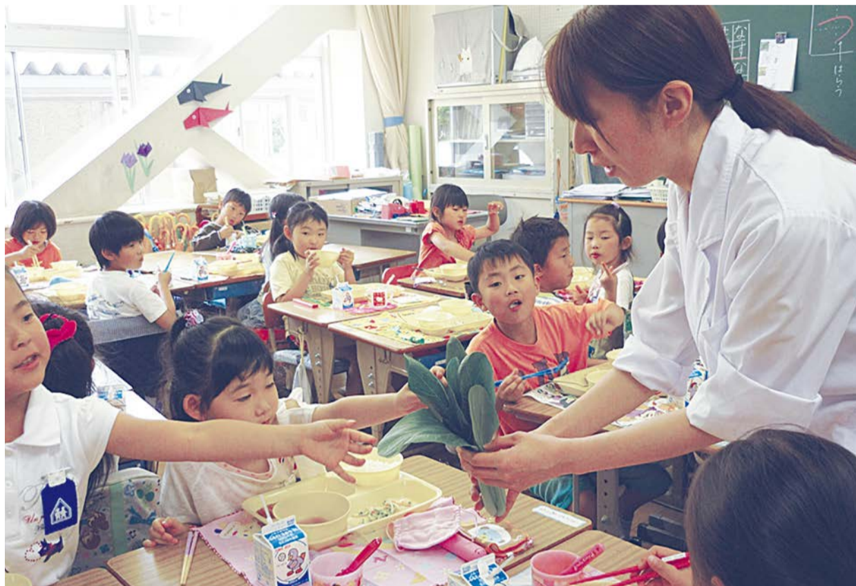
栄小学校 給食指導のようす (※8ページに写真説明があります。)

発行：吉川市議会 編集：吉川市議会広報委員会 〒342-8501 吉川市吉川二丁目1番地1 TEL & FAX (982) 9421 http://www.city.yoshikawa.saitama.jp