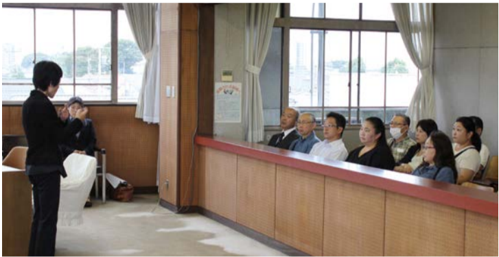
議場での手話通訳の様子

手話とは、日本語を音声では なく手や指、体などの動きや顔 の表情を使う独自の語彙や文法 体系をもつ言語です。手話を使 う聴覚障害者にとって、聞こえ る人たちの音声言語と同様に、 大切な情報獲得とコミュニケー ションの手段として大切に守ら れてきました。 しかしながら、ろう学校では