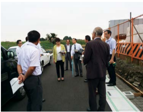
路線認定の現地視察