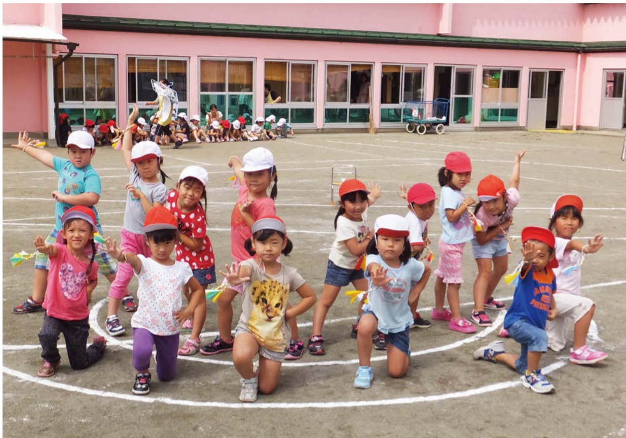
運動会の練習中のようす (※8ページに写真説明があります。)

発行：吉川市議会 編集：吉川市議会広報委員会 〒342-8501 吉川市吉川二丁目1番地1 TEL & FAX (982) 9421 http://www.city.yoshikawa.saitama.jp