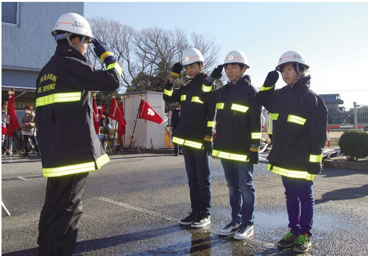
消防出初め式（※8ページに説明があります。）

発行：吉川市議会 編集：吉川市議会広報委員会 〒342-8501 吉川市吉川二丁目1番地1 TEL & FAX (982) 9421 http://www.city.yoshikawa.saitama.jp