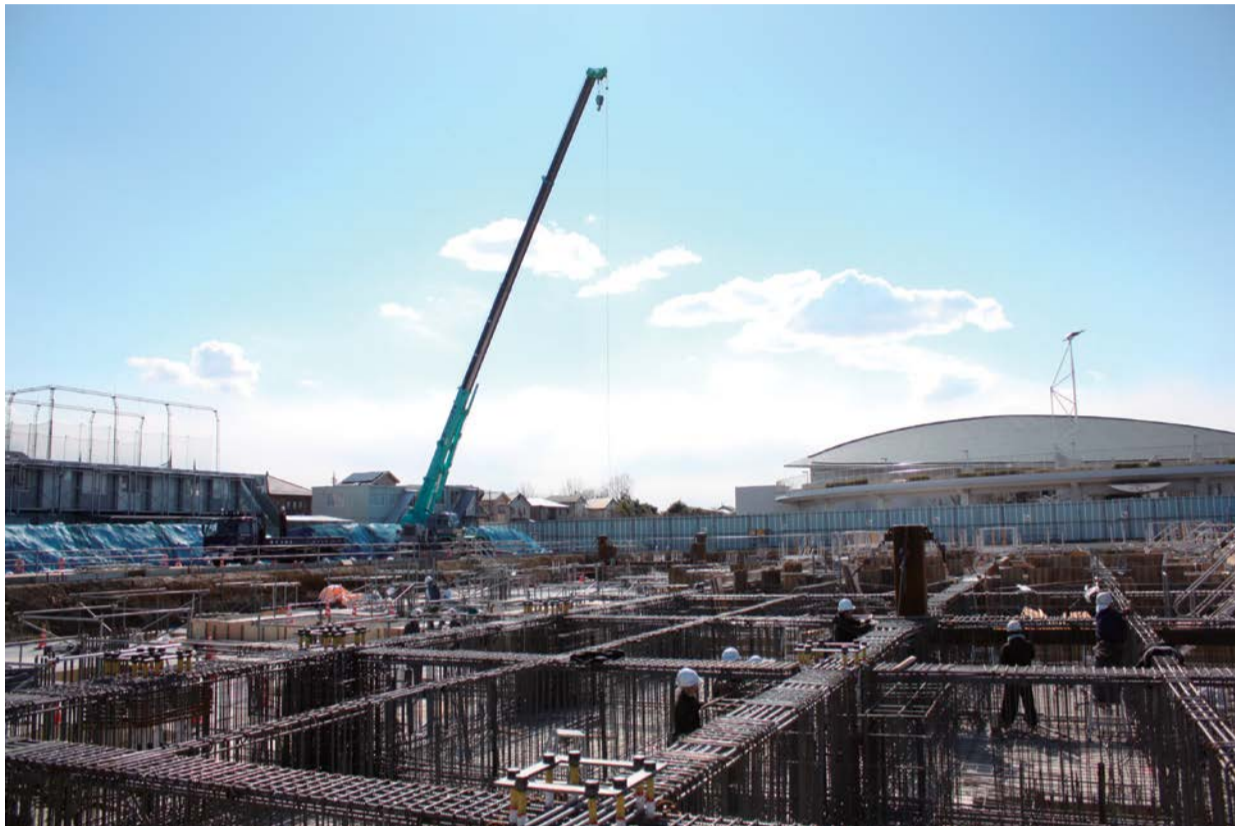
新庁舎 建設中のようす（※8ページに説明があります。）

発行：吉川市議会 編集：吉川市議会広報委員会 〒342-8501 吉川市吉川二丁目1番地1 TEL & FAX (982) 9421 http://www.city.yoshikawa.saitama.jp