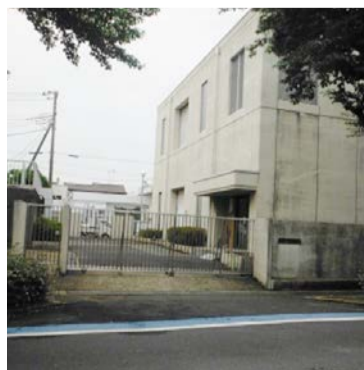
工事予定の高久ポンプ場