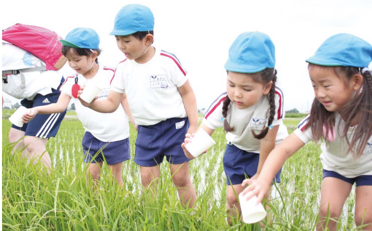
ほたるの幼虫を田んぼに放流するようす（※7ページに写真説明があります。）

発行：吉川市議会 編集：吉川市議会広報委員会 〒342-8501 吉川市吉川二丁目1番地1 TEL & FAX (982) 9421 http://www.city.yoshikawa.saitama.jp