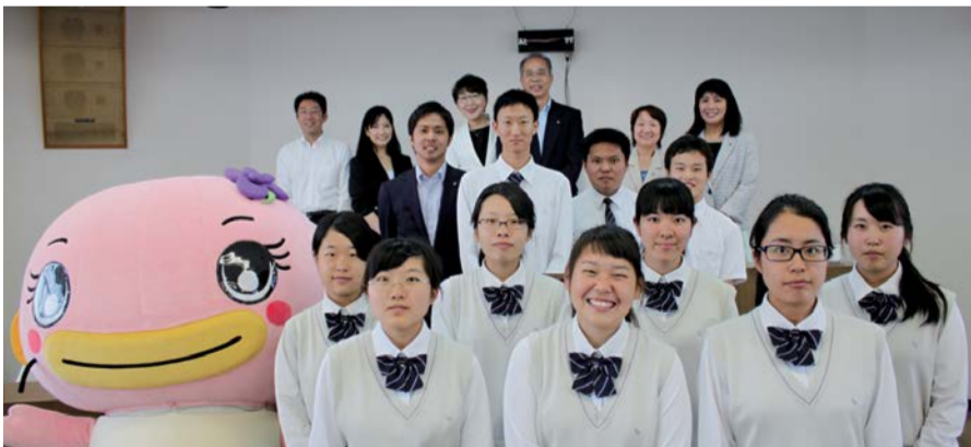
☆模擬議会が終わって吉川美南高校のみなさん、広報委員の議員、なまりんも一緒に笑顔で集合写真