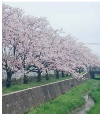
さくら通りの満開の桜

答 市民生活部長 市の桜の魅力は市内外に伝えることが地域産業全体の活性化に繋がると捉え、市観光協会と連携し、さくらまつりの展開について検討する。