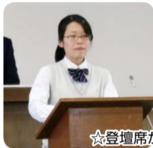
☆登壇席から質問するようす

吉川美南駅東口の発展について、 ①お店などはできないのですか。 ②外灯の設置についてはどうですか。