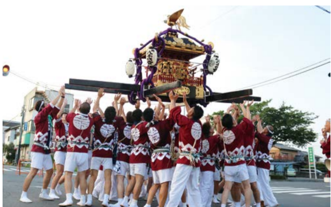
八坂祭りのあばれ神輿