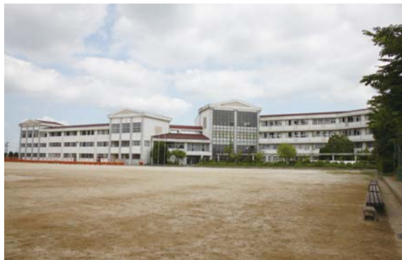
大規模改修が行われる東中学校校舎

東中学校校舎大規模改修を行うため、工事請負契約（建築工事、機械設備工事）を締結します。