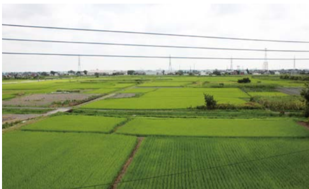
吉川美南駅東口周辺地区

吉川美南駅東口周辺地区土地画整理事業の円滑な運営及びその経理の適正を図るため、吉川市吉川美南駅東口周辺地区土地画整理事業特別会計を設置します。