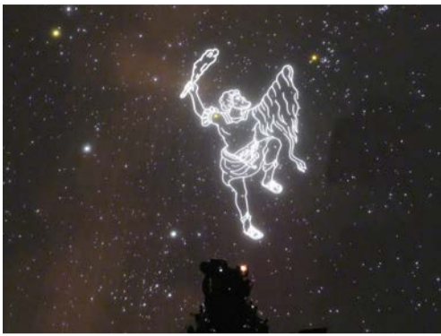
ワンダーランドのプラネタリウム

答 こども福祉部長 水く土は館長を含む4名が勤務、日く火は職員が2名、イベント時等には臨時職員が入り勤務している。問 市内4年生の月や星の単円で活用してはどうか。答 こども福祉部長 5月の校長会にて美南、吉川小で実施決定。他校でも今年度中に実施の予定。