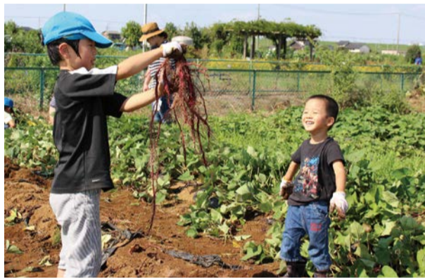
市内のあちこちで秋を楽しむイベントが開催されました。