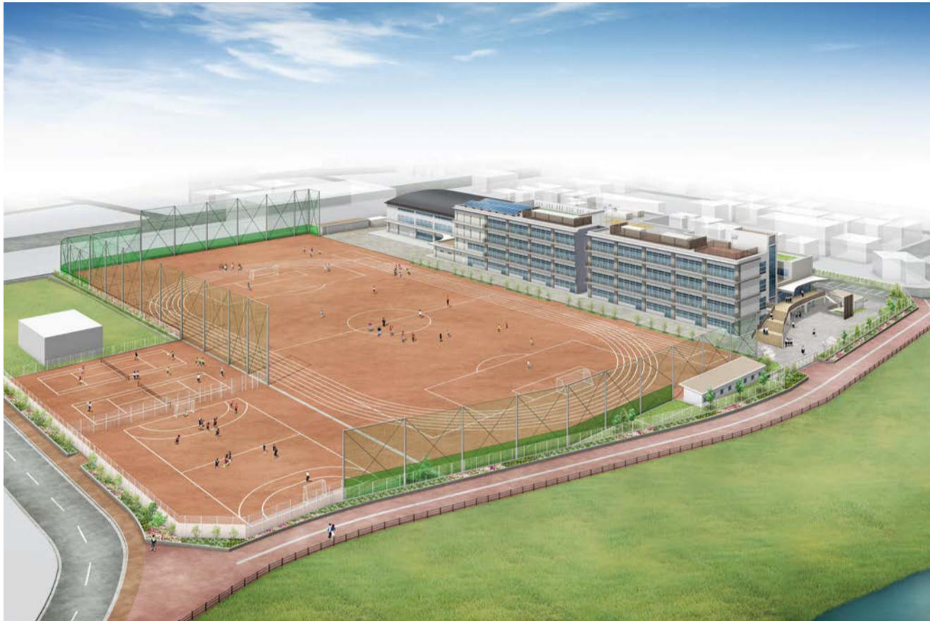
吉川中学校完成予想図

発行：吉川市議会 編集：吉川市議会広報委員会 〒342-8501 吉川市きよみ野一丁目1番地 TEL (982) 9421 (981) 5392 http://www.city.yoshikawa.saitama.jp