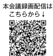
本会議録画配信はこちらから↓

今定例会では、19名の議員が市政全般にわたり、市の見解をたてました。その主な内容を質問者が要約してお知らせします。詳細は会議録をご覧ください。会議録はホームページや市立図書館で閲覧できますが、今定例会の会議録の提供は3月上旬となる予定です。