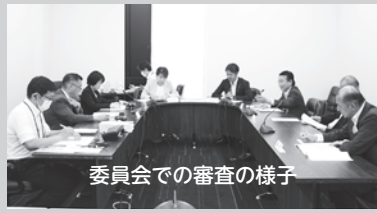
委員会での審査の様子

これまで、本会議の会議録のみインターネットで公開していましたが、令和5年3月定例会分からは、委員会の会議録もご覧いただけようになりましたので、ぜひご活用ください。 平成15年以前の「本会議の会議録」、令和4年以前の「委員会の会議録」は、冊子で保管されています。これらの会議録は、市立図書館や議会事務局図書室で閲覧できます。